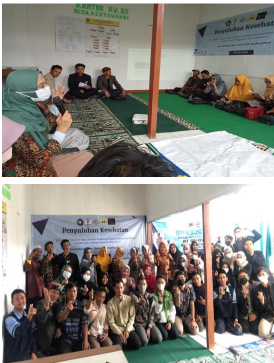
Gambar 2. Kegiatan Pemaparan materi, pembuatan produk dan foto Bersama

Pemaparan mengenai pola hidup sehat dan pemanfaatan tanaman herbal menjadi acara pertama dalam kegiatan pengabdian ini, disertai dengan diskusi mengenai permasalahan kesehatan yang dialami oleh warga (Gambar 2).