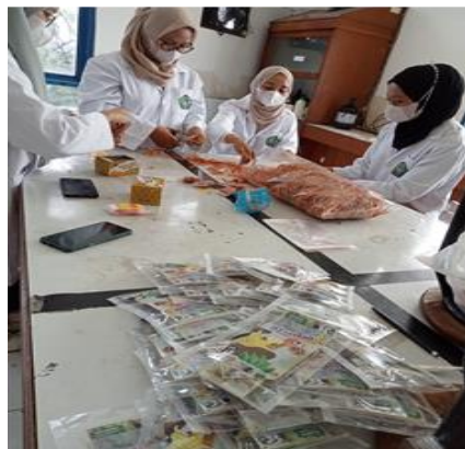
Gambar 1. Orientasi pembuatan minuman herbal dan parem

Orientasi pembuatan produk parem dan minuman herbal dilakukan di kampus Sekolah Tinggi Farmasi Indonesia dengan melibatkan mahasiswa (Gambar 1). Sebagai informasi tambahan pada setiap kemasan ataupun brosur dari produk dilengkaikan dengan cara pembuatan (Gambar 2 dan 3) Dalam brosur diberikan informasi yang lebih lengkap mengenai sesua bahan yang digunakan dalam pembuatan produk, beserta khasiat yang telah banyak diteliti, sebagai bahan pengetahuan bagi warga setempat. Karena berdasarkan hasil diskusi, masyarakat desa mengenal tanaman yang digunakan dalam minuman herbal dan parem, sebagai bahan dapur, serta hanya sedikit sekali pengetahuan mengenai hasiat obat dari tanaman tersebut.